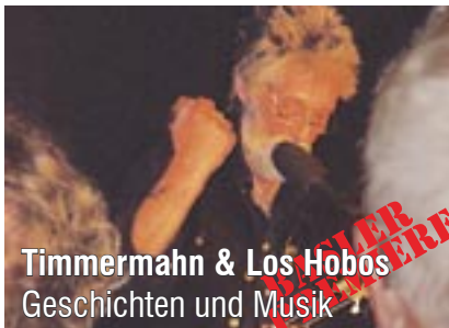
Timmermann & Los Hobos Geschichten und Musik