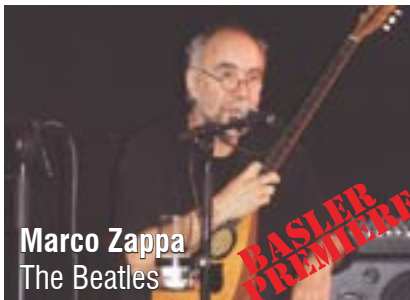
Marco Zappa The Beatles