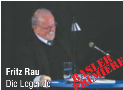
Fritz Rau Die Legende

Abenteuer Kultur. Fünf Mal haben wir das Publikum zu aussergewöhnlichen Abenden geladen. Fünf Mal haben wir aussergewöhnliche Künstler erleben dürfen. Fünf Mal haben wir eine aussergewöhnliche Stimmung genossen.